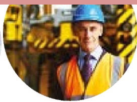
Technicien en hygiène et sécurité