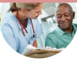
Infirmier santé travail