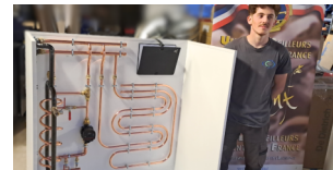
Excellence des Métiers