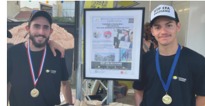
Excellence des Métiers