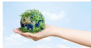
Prévention-Santé- Environnement (PSE)