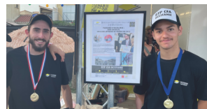
Excellence des Métiers