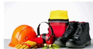
Santé Sécurité au Travail (SST)