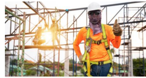
Santé Sécurité au Travail (SST)