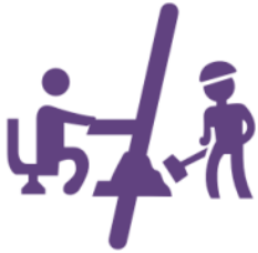
Rythme alterné CFA/EntrepriSe