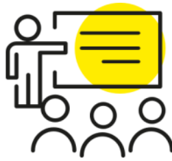
Salles de cours connectées