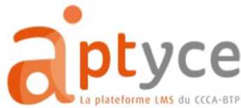
Enseignements en digital learning