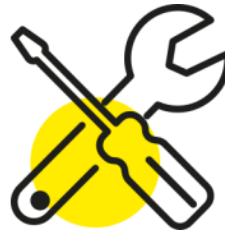
Malette d'outillage individuelle et collective